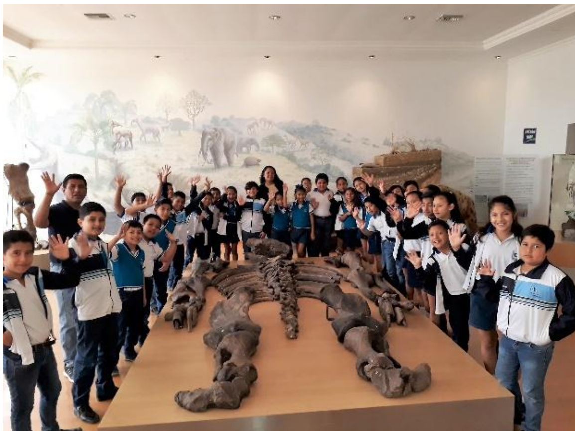
El 07 de diciembre, se recibió la visita de 80 estudiantes de la Unidad Distrital Apoyo Pedagógica la Inclusión de las Unidades Educativas Teodoro Wolf, Juan Panchana y Francisco de Miranda.