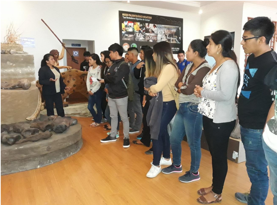
Estudiantes del Sistema de Nivelación y Admisión carrera de Comunicación Social de la UPSE, visitaron las instalaciones del Museo Paleontológico Megaterio, el 17 de julio.