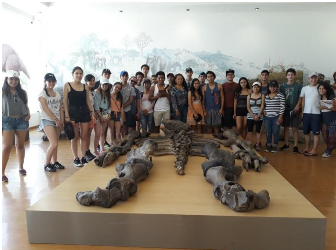
Cuarenta y seis estudiantes de la Universidad San Francisco de Quito , que realizaron un recorrido por los diferentes atractivos turísticos de la provincia de Santa Elena, el 23 de febrero .