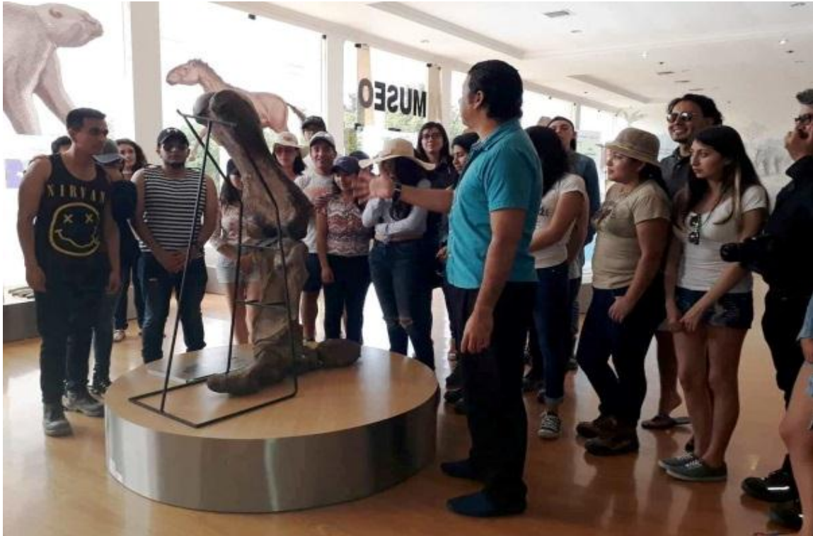
El 19 de julio, se recibió la visita de 30 estudiantes de la Carrera Ingeniería Ambiental, de la Escuela Politécnica Nacional, de la ciudad de Quito.