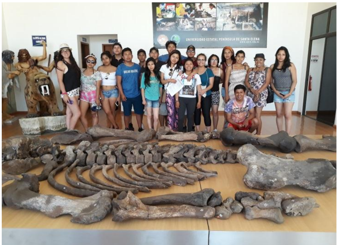
Visita de 24 estudiantes de la Universidad Nacional de Chimborazo en una Gira de Observación que incluyó el museo, el 1 de febrero del presente año.