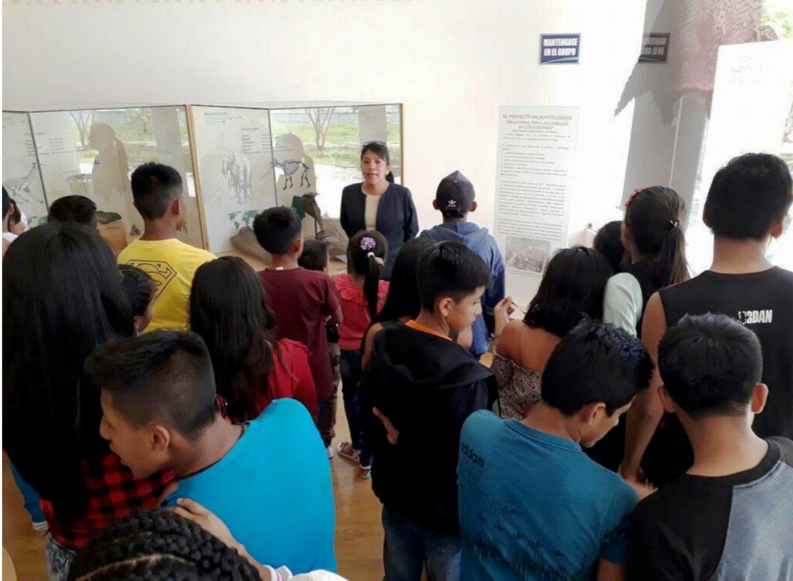
El 07 de marzo, se recibió la visita de 27 estudiantes de Noveno Año de la E.E.B. Miguel De Letamendi de la ciudad de Guayaquil, en las instalaciones del Museo Megaterio.