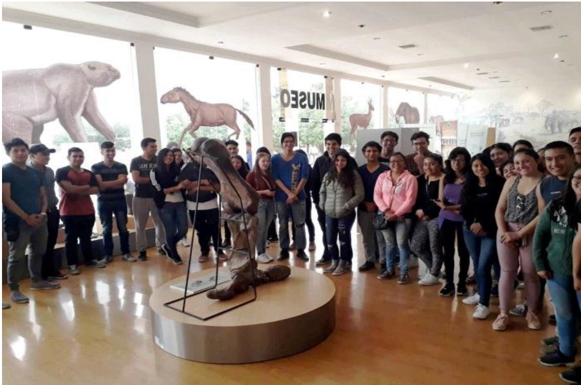
El 13 de julio, se recibió la visita de 40 estudiantes de la Carrera Biotecnología Ambiental, de la Escuela Superior Politécnica de Chimborazo.