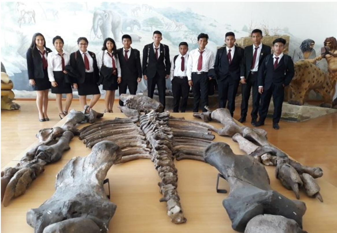
Estudiantes de Tercer Año de Bachillerato del Colegio Mixto Particular UPSE, en su visita al Museo Paleontológico Megaterio, el 17 de enero.