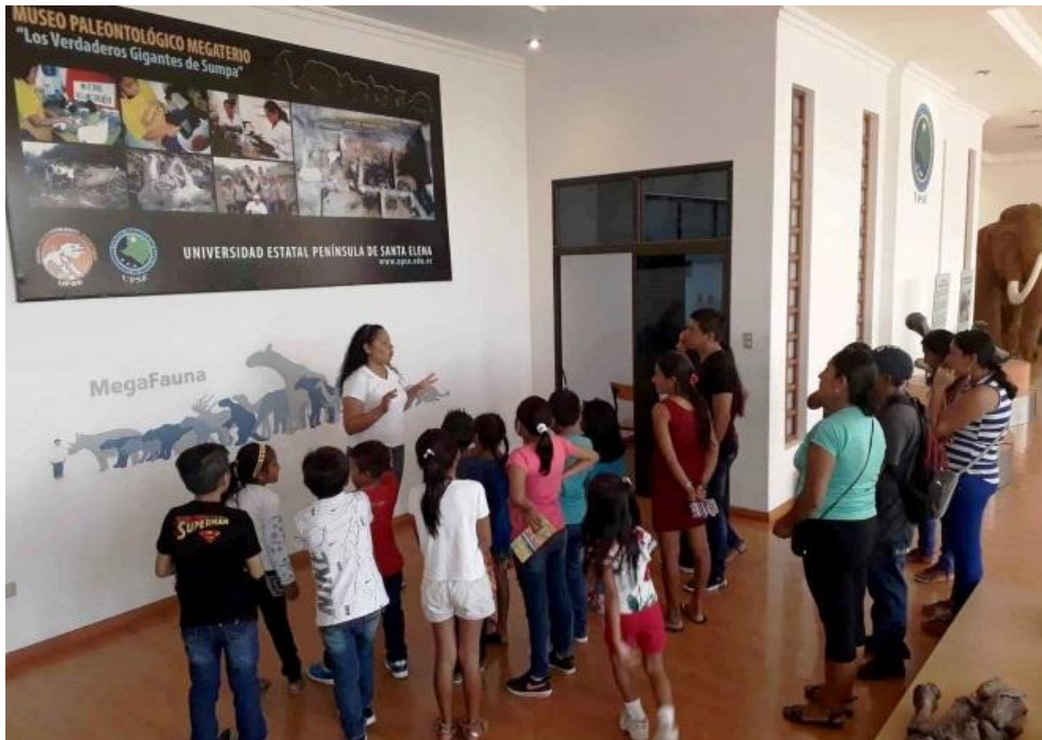
Estudiantes y padres de familia de la Unidad Educativa Ballenita del cantón Santa Elena, recibiendo charla educativa por parte de la mediadora del museo, el 23 de mayo .