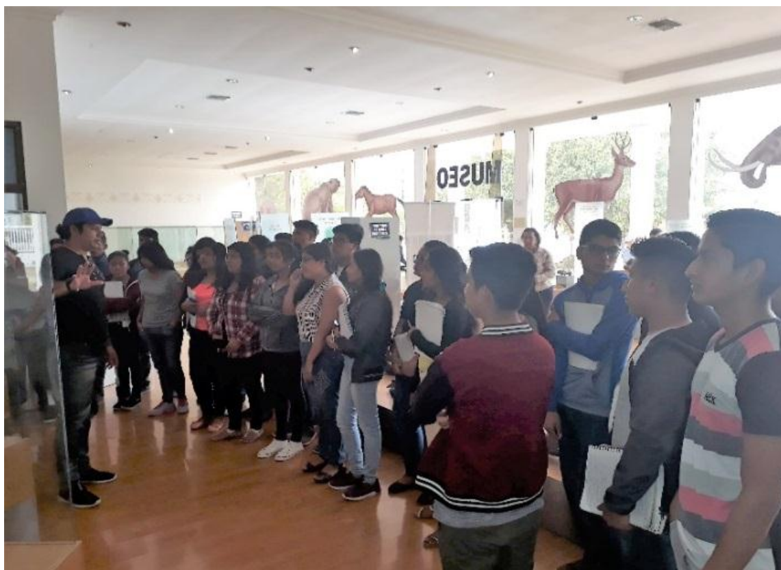
El 13 de diciembre, se recibió la visita de un grupo de 27 estudiantes de la carrera de Educación Básica de la UPSE, con la finalidad de reforzar sus conocimientos paleontológicos.