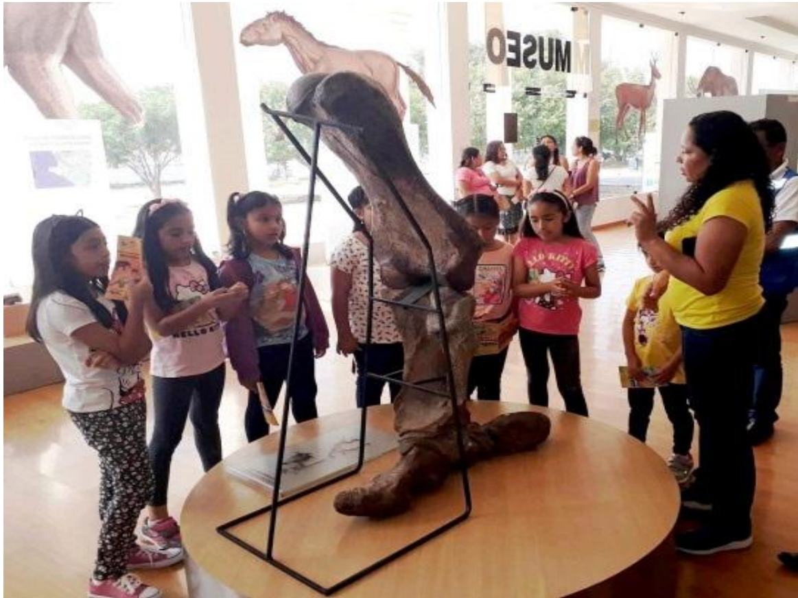
Del 6 al 12 de junio, estudiantes de la Unidad Educativa Rubira visitaron las instalaciones del museo, con la finalidad de realizar una tarea de investigación enviada por sus institución