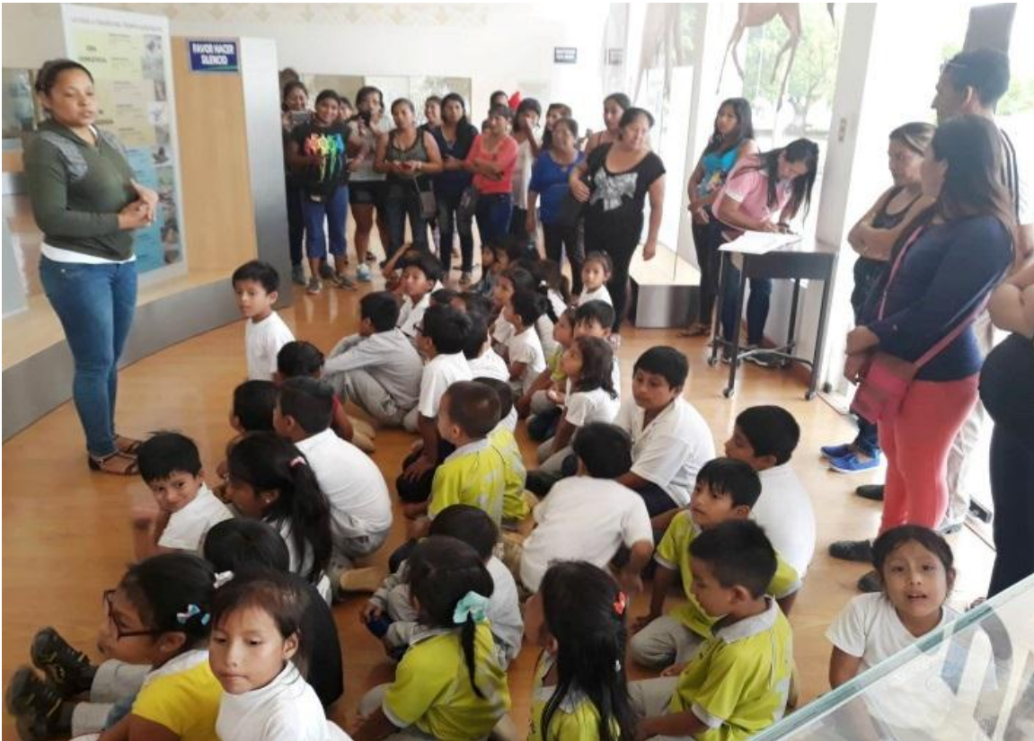
El 8 de febrero, se recibió la visita de estudiantes de Preparatoria y padres de familia de la E.E.B. Presidente Tamayo , de la Parroquia José Luis Tamayo, cantón Salinas.