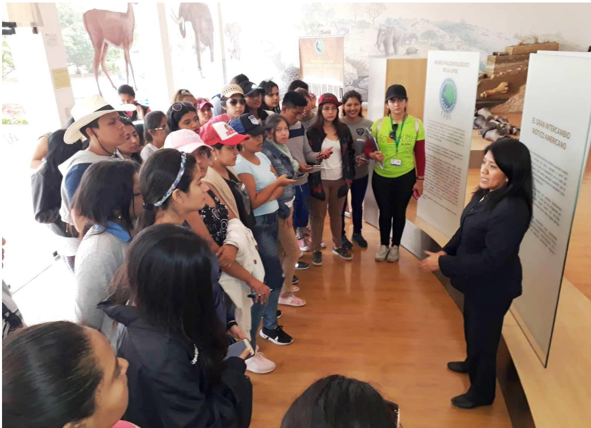
El 19 de julio, se recibió la visita de 34 estudiantes de Segundo Semestre de la Carrera Tecnologías de la Información, de la Universidad Agraria de Milagro.