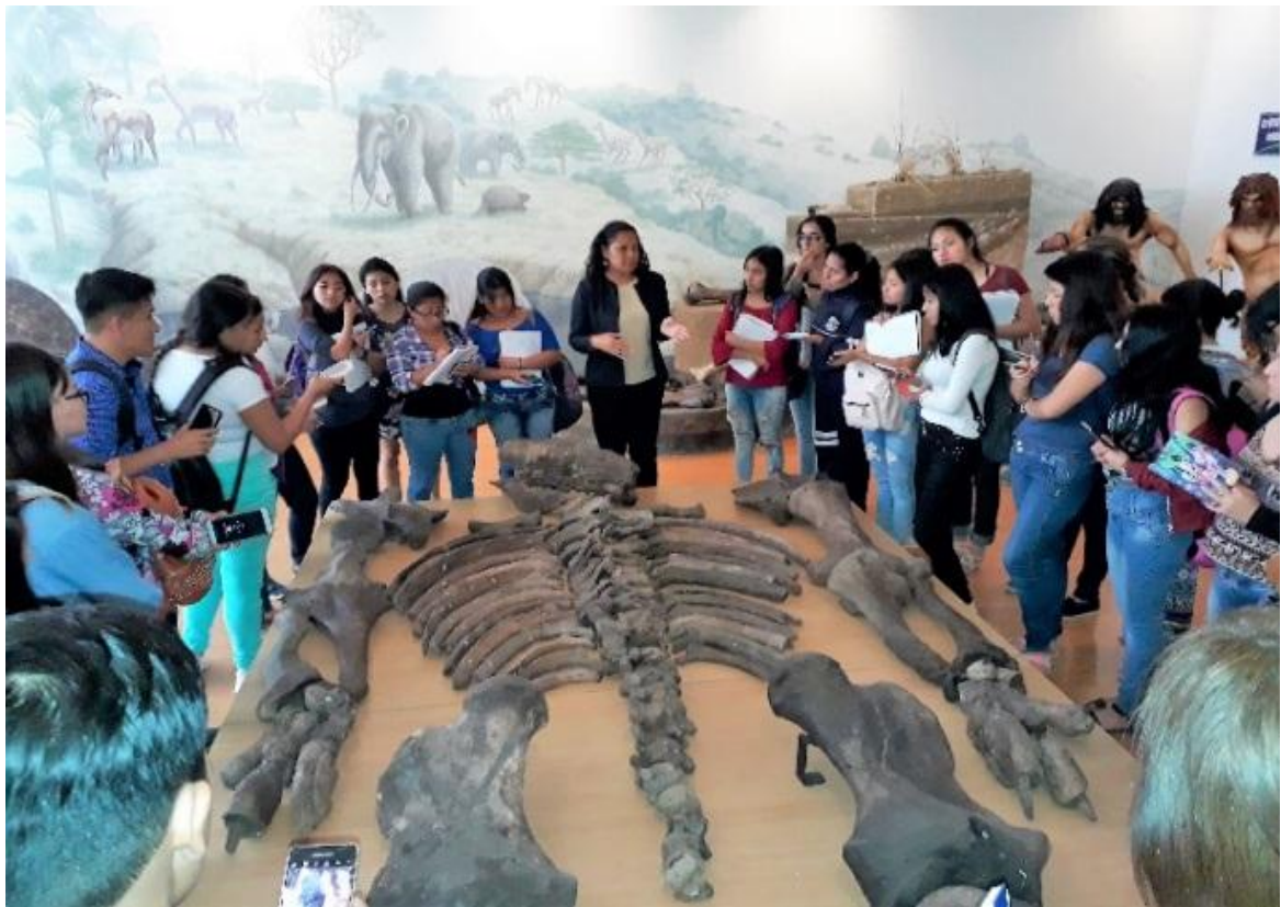
El 23 de octubre, recibimos la visita de 45 estudiantes de la Carrera de Educación Inicial paralelo 1/1 de la UPSE , como parte de refuerzo de la asignatura Sociología.