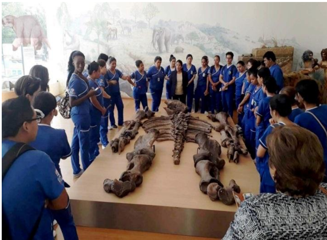
Cincuenta estudiantes de Auxiliares de Enfermería del Instituto Superior Tecnológico Ecuatoriano de la ciudad de Guayaquil visitaron el museo el 15 de junio y recorrieron las instalaciones.