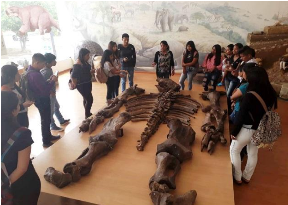
El 17 de mayo, se recibió la visita de 46 estudiantes del paralelo 2/1 de la Carrera de Educación Inicial de la UPSE, como parte de su recorrido por diversas dependencias.