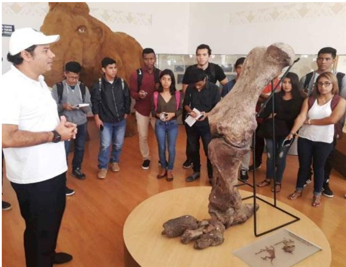
EL 29 de mayo , nos visitaron 40 estudiantes de la Carrera de Tecnología de la Información de la UPSE , quienes recibieron la mediación, junto a extremidad de perezoso terrestre gigante.