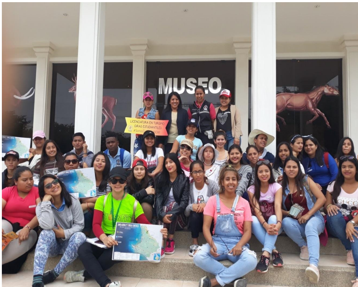
El 19 de julio, además se recibió la visita de 34 estudiantes de Primer Semestre, de la Carrera Licenciatura en Turismo, de la Universidad Estatal de Milagro, de la provincia del Guayas.