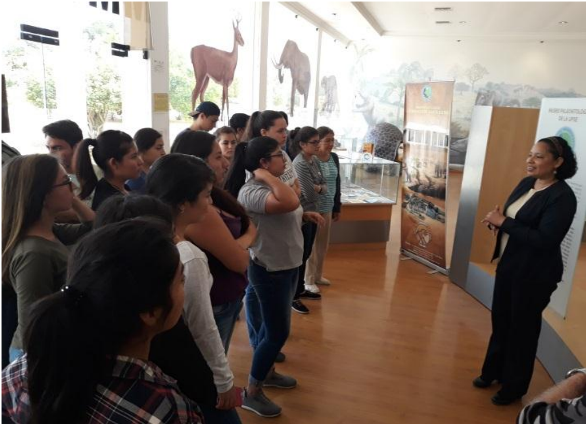
Estudiantes de la Universidad de Guayaquil de la provincia del Guayas, visitaron las Instalaciones del museo, el 26 de enero siendo atendidos por los mediadores educativos.