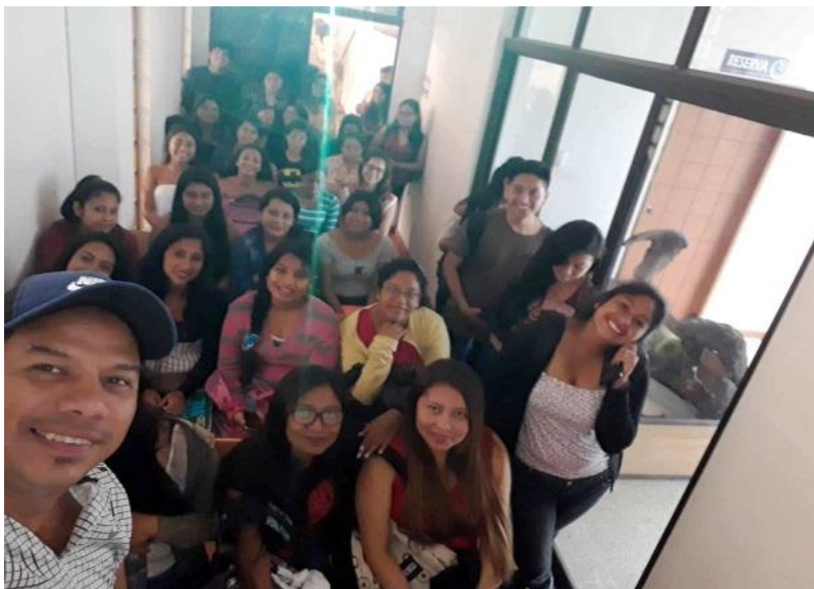
Proyección de video educativo a 37 estudiantes de la Carrera Educación Inicial de la UPSE, en la sala de audiovisuales del museo el 22 de mayo.