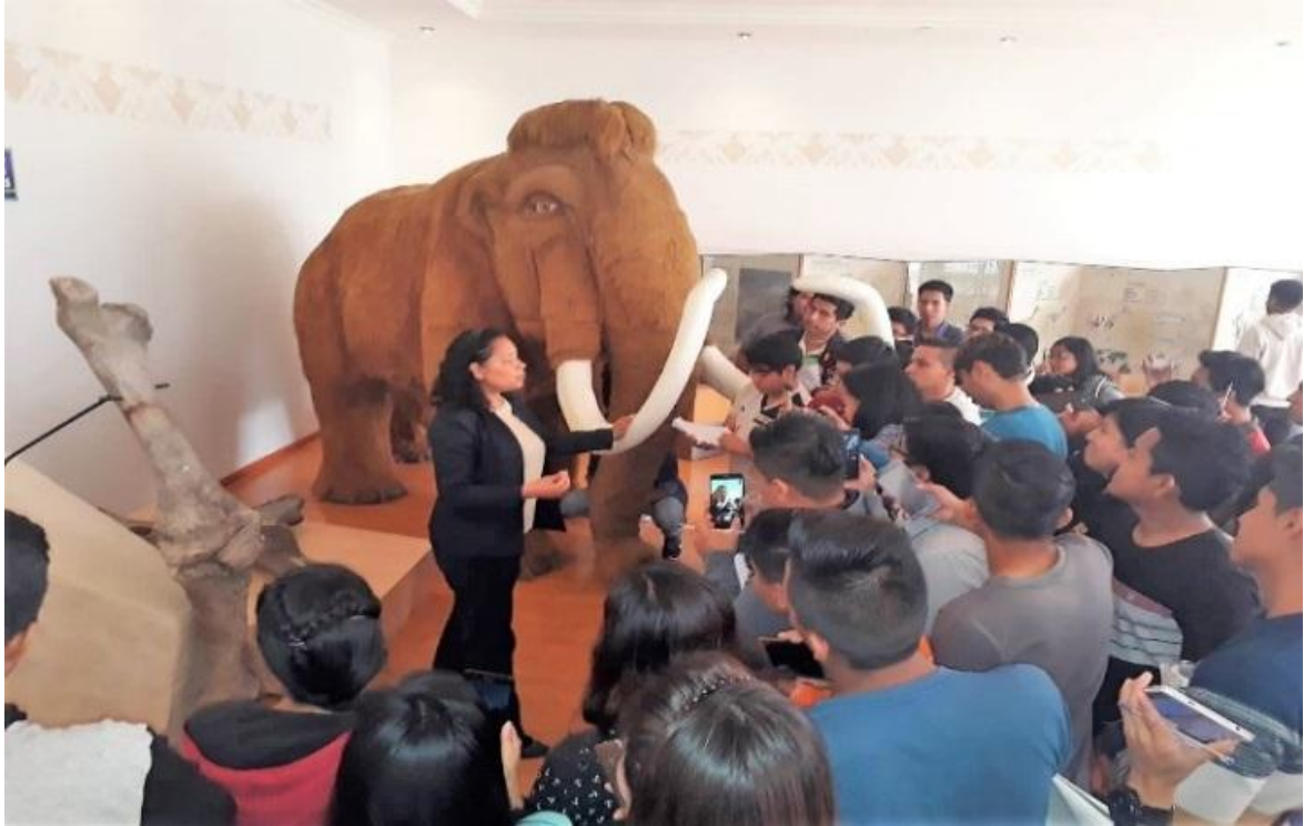
El 16 de octubre, se recibió la visita de 40 estudiantes de la Carrera de Tecnología de la información de la UPSE , con el propósito instruirse con lo que respecta a los hallazgos de megafauna de Tanque Loma