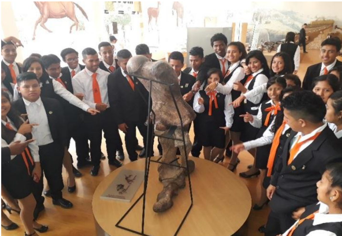
El 19 de septiembre, recibimos la visita de 45 estudiantes de la Unidad Educativa “Virginia Reyes González” , de la Parroquia Anconito, Cantón Santa Elena, como parte de una gira de observación.