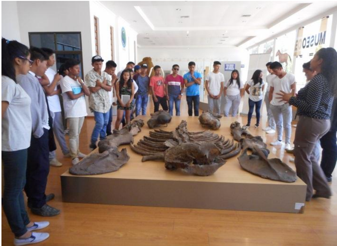
El 12 de enero, se recibió la visita de 30 estudiantes de Tercer Año de Bachillerato de la Unidad Educativa Manglaralto, del cantón Santa Elena, quienes recorrieron los atractivos de la provincia.