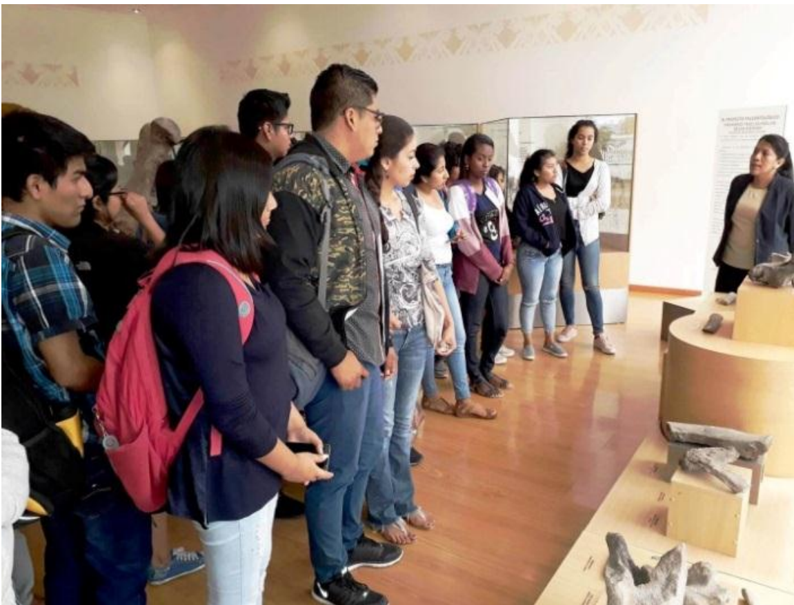
El 21 de junio, 29 estudiantes del 1/2 de la carrera de Comunicación Social de la UPSE, visitaron el Museo Paleontológico Megaterio, recibiendo la respectiva mediación.