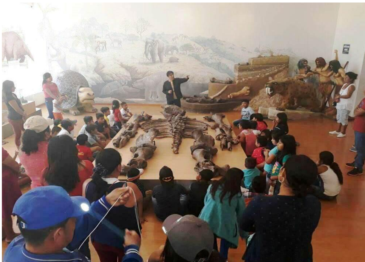
Cuarenta y tres estudiantes de la E.E.B. Antonio José de Sucre de la comuna Pechiche, cantón Santa Elena, en su visita al Museo Paleontológico Megaterio, el 01 de marzo .