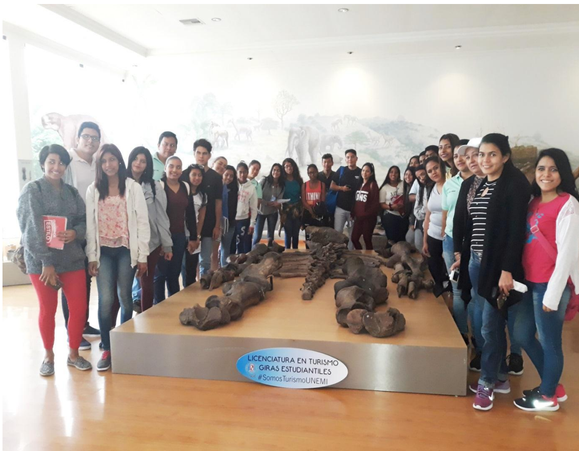
El 17 de julio, se recibió la visita de 31 estudiantes de Primer Semestre de la Carrera Licenciatura en Turismo de la Universidad Estatal de Milagro, como parte de las giras estudiantiles.