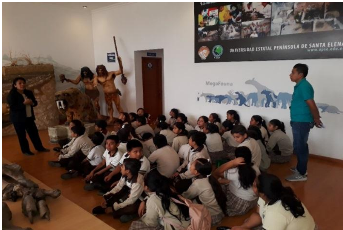
El 31 de agosto, recibimos la visita de 38 estudiantes de la E.E. B. Pedro María Zambrano Reyes del Cantón Salinas, quienes recibieron las explicaciones correspondientes.