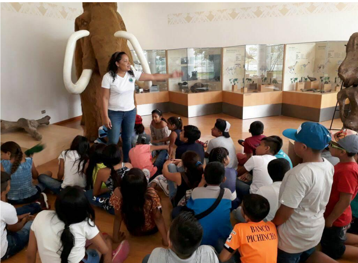
El 15 de febrero, se recibió la visita de 65 estudiantes de 7mo Año de la E.E.B. Juana Tola de la Parroquia Juan Gómez Rendón (Progreso) del cantón Guayaquil, provincia del Guayas.