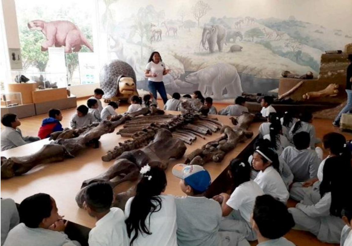
El 21 de junio, se recibió la visita de 40 estudiantes de la E.E.B. Presidente Tamayo de José Luis Tamayo. En esta foto reciben la mediación junto al esqueleto del perezoso.