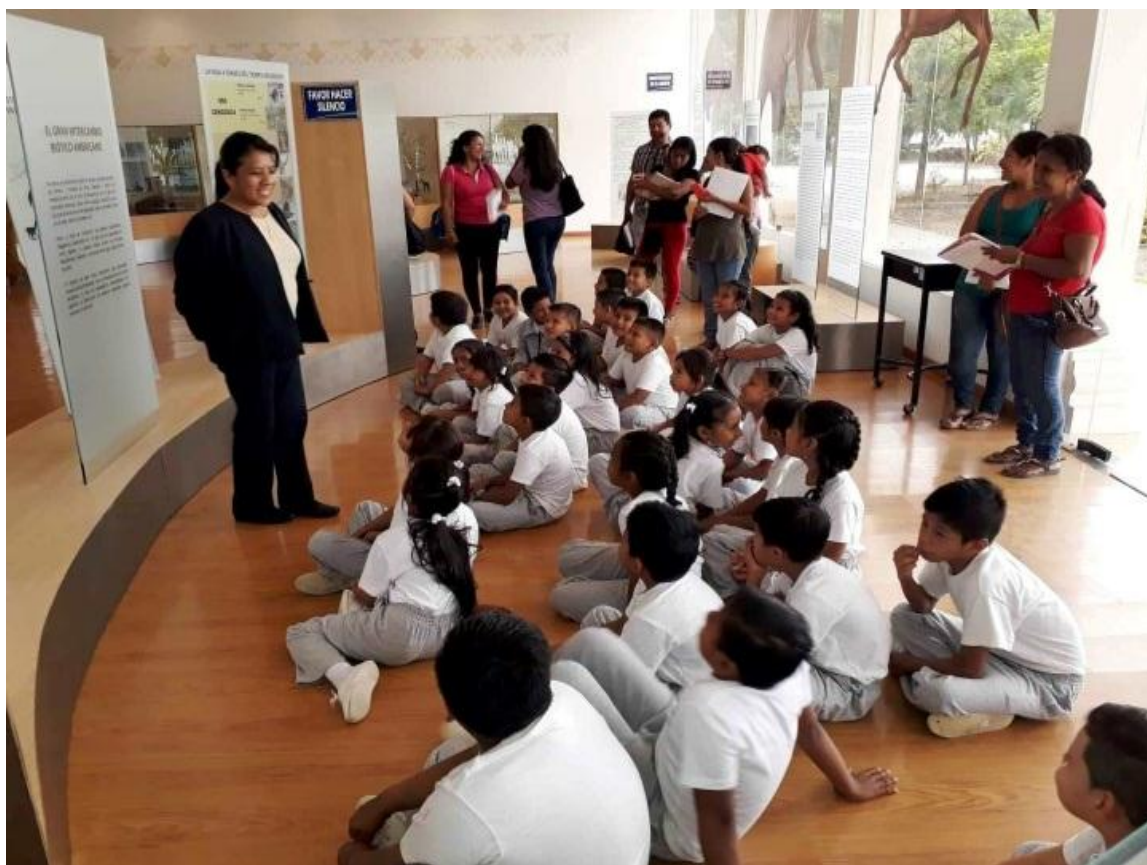
EL 23 de mayo, se recibió la visita de 37 estudiantes de la E.E.B. Mercedes Moreno Irigoyen de la Parroquia José Luis Tamayo cantón Salinas en el Museo Megaterio.